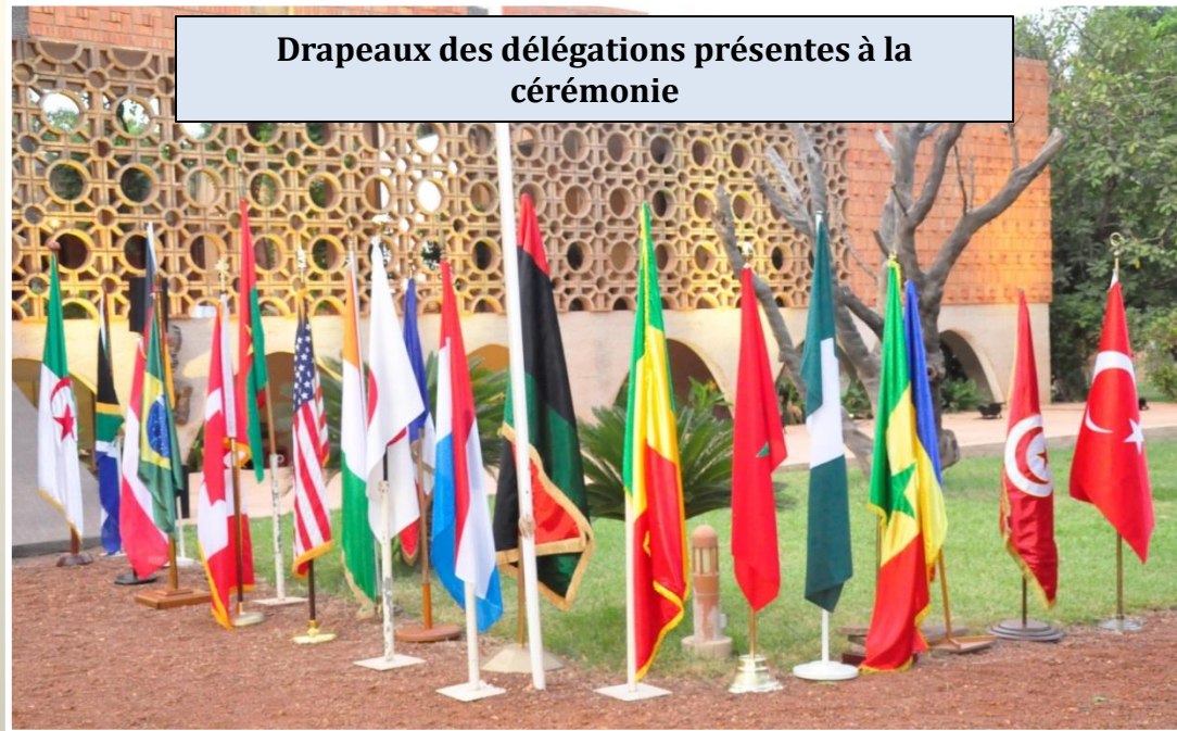
Drapeaux des délégations présentes à la cérémonie

A Ouagadougou, cette cérémonie exceptionnelle présidée par l'ambassadeur de France et le chef d'état-major général des armées burkinabè, a rassemblé de nombreuses délégations diplomatiques, des militaires burkinabè, français et américains, des anciens combattants burkinabè, des dirigeants de la société civile, des professeurs et élèves du lycée français Saint-Exupéry, de l'International school of Ouagadougou, du groupe scolaire des Lauréats et du Prytanée militaire du Kadiogo ainsi que de nombreuses familles.