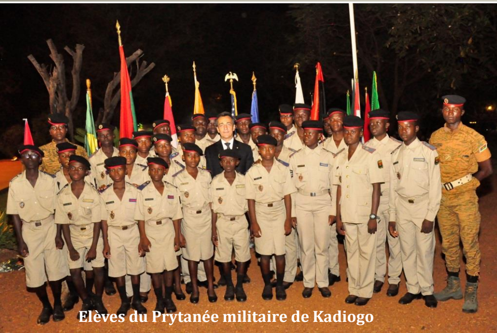
Elèves du Prytanée militaire de Kadiogo