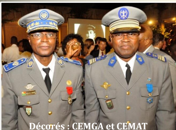
Décorés : CEMGA et CEMAT